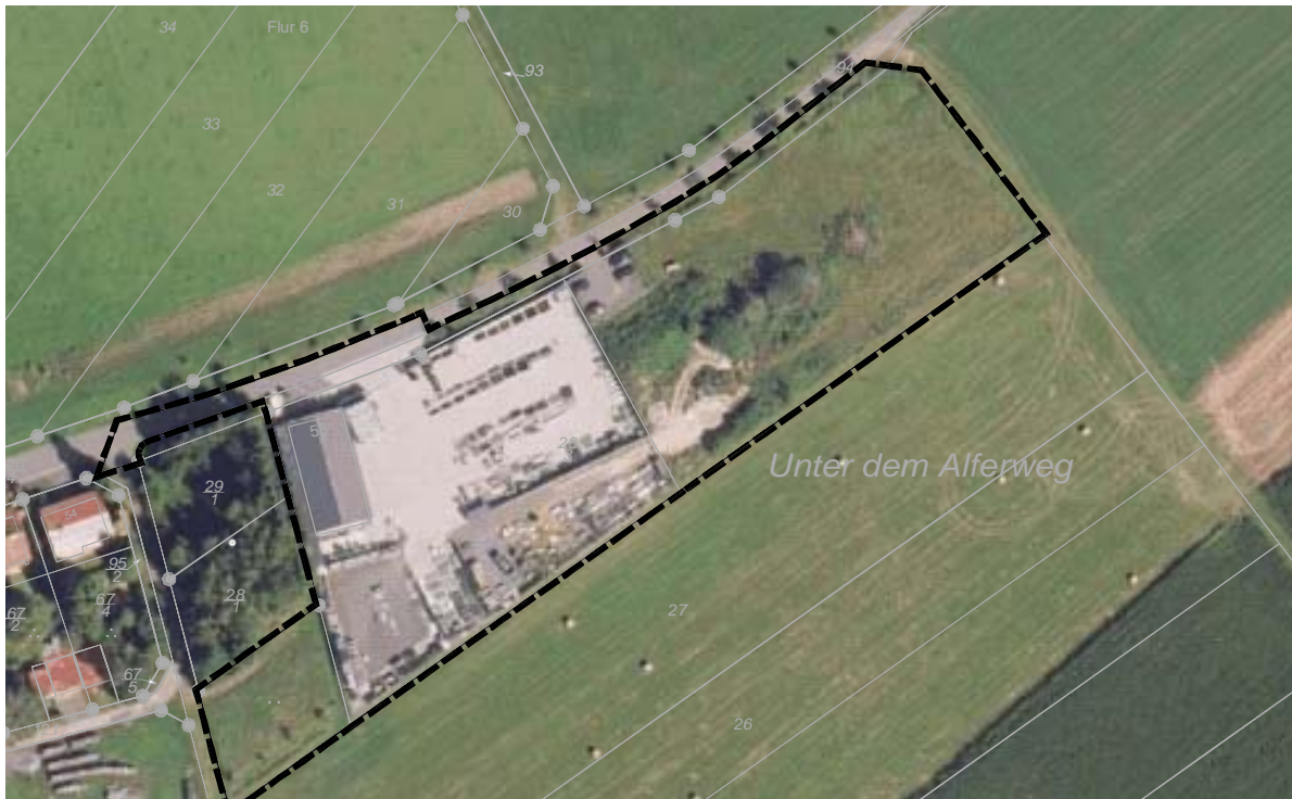
Abbildung 1: Luftbild, Geoportal RLP